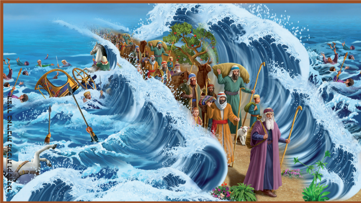
הדגים שוויתרו על גופות המצריים כדי לחזק אמונת ישראל

איזה מצוה מדובר כאן: "ישלם לו", הקב"ה ישלם מה שהוציא על שבת קודש שקדושתה נמשכת ל"ו שעות.