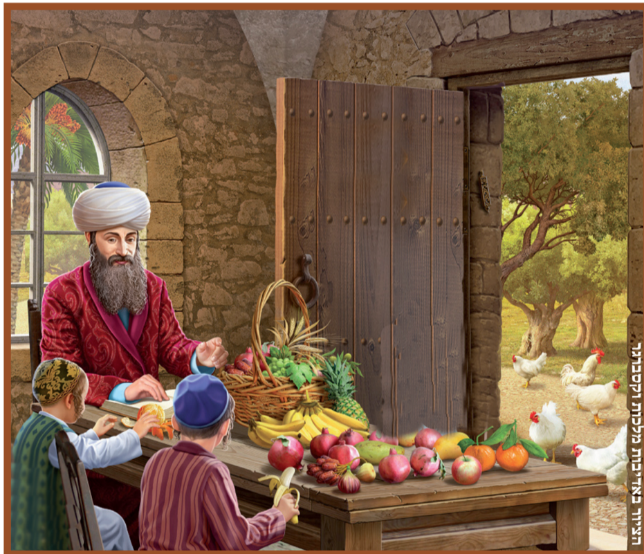
"ראש השנה לאילן" – לתקן חטא עץ הדעת

בית הלל שמדתם אהבה סוברים, שעיקר השפע יוצא בחג הסוכות כאשר שבו ישראל בתשובה מאהבה